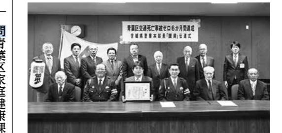
▲区長(下段左から3番目)は「地域で交通安全に取り組んでいる皆さまの日頃の努力の賜物」と深い感謝と敬意を表しました 問 青葉区民生生活課 ☎225・7211(内線6142)

青葉区管内で 半年間交通死亡事故ゼロ達成 区民の皆さまおよび交通安全に関わる各種団体の日々の努力により、青葉区管内で平成30年10月22日から平成31年4月22日までの半年間、交通死亡事故ゼロが達成されました。このことに伴い、4月23日に宮城県警察本部長より青葉区へ「讃辞」の賞状が贈呈されました。