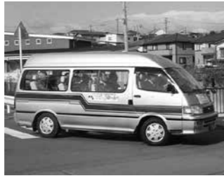
▲4月2日午前8時に出発した第1便の「のりあい・つばめ」。毎週火・水・金曜日1日8便運行します

「みんなでつくろう地域交通スタート支援事業」は、地域の方が主体となり、地域の足の確保に取り組む団体に対して、市が経費の助成などを行う事業です。 丘陵地で道路が狭く、大型バスの運行が難しい宮城野区燕沢地区では、日常生活に必要不可欠な移動手段を確保するため、本事業を活用して、既存の公共交通を補完する「地域交通」の導入を検討しています。