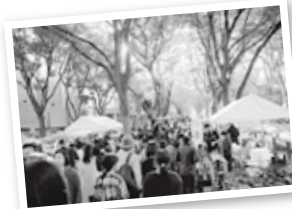
昭和30年代から植栽されたケヤキが成長し、定禅寺通は「杜の都」の象徴に。グリーンベルトではイベントが開催されるなど、にぎわいの発信地にもなっています

そして二つ目は、経済効果です。「杜の都」というイメージや風格によって、そんな仙台だから住んでみたい、働いてみたいなど、都市経済を活性化するエネルギーの一つにもなっています。例えば、昭和40年代に開発された泉パークタウンは、日本の中でも最高水準の住宅地域です。この水準が先例となり、その後の民間企業による開発も質の高いものが続き