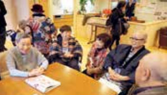
▲ロビーには、居住者や地域の自然な姿が