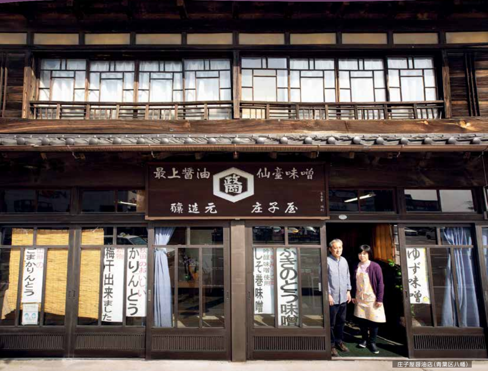
庄子屋醤油店(青葉区八幡)

江戸時代末期からみそとしょうゆの醸造を営む老舗、庄子屋醤油店。昭和11年に建てられ、門前町の面影を今に伝える建物は、「杜の都景観重要建造物等」に指定されています。