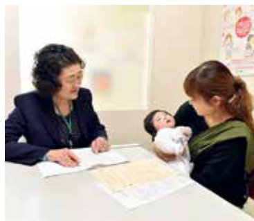
育児相談や授乳ケアが受けられる産後ケア事業など、産後の母親に寄り添ったサポートを行います

子どもが健やかに学び育つことのできる環境づくりに向けて、いじめや不登校などの未然防止、早期の発見と対応のため、スクール