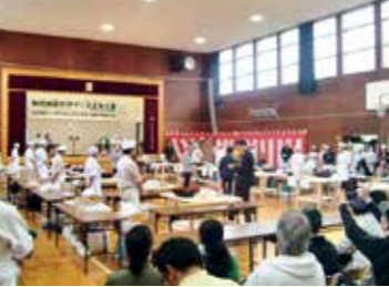
秋保地区で採れたソバを使った「仙台秋保そばフェス」のそば打ち大会

ふるさと底力向上プロジェクト 生田・坪沼地区の活性化支援を引き続き行うほか、秋保地区の魅力ある体験型観光の創出や観光客と市民との交流促進など、西部中山間地の活性化と地域力の向上に努めます。