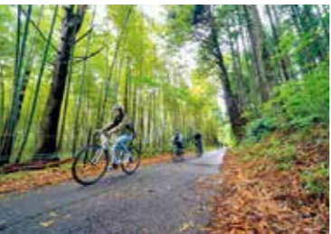
外国人にも好評な、泉西部地区の自然や歴史などの地域資源を巡るサイクリング体験

ふるさと底力向上プロジェクト 少子高齢化が進む郊外居住地区において、地域・大学・事業者等が連携し、課題を解決する取り組みへの支援を行います。また、住民による泉西部地区の将来のまちづくりの検討を支援するとともに、地域資源の認知度向上や誘客に向けた情報発信を行い、魅力あるまちづくりと地域の活性化を図ります。