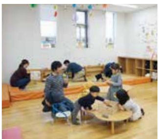
子育てふれあいプラザ（のびすく）の運営など、子育て家庭を応援する地域づくりを進めます

686億1507万円 安心して子どもを生み育てることができるよう、認可保育所等の保育基盤の整備等に取り組むほか、子育てを地域社会全体で支える取り組みを進めるなど、未来を担う子どもたちが健やかに育つことができるよう各種施策を推進します。