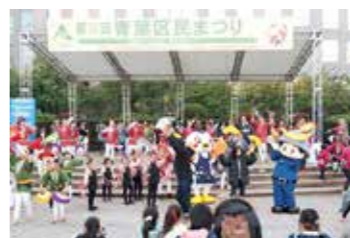
▲「青葉区民まつり」のフィナーレを飾り、幅広い世代が参加するすずめ踊り総踊り

区民協働まちづくり事業 区民の皆さんや地域団体などとの協働により、「青葉区民まつり」、「宮城地区まつり」などを企画・開催するとともに、区民主体の各種イベントを支援します。また、地域のコミュニティ活性化、子育て、防災等の地域課題に取り組みまちづくり活動への助成を行います。さらに、マンシヨンのコミュニティ形成の促進に向けた取り組みを進めます。