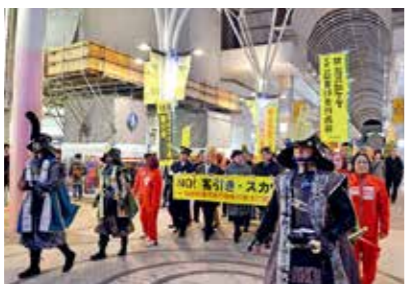
条例制定に併せ、中心部商店街・国分町地区で、商店街関係者、警察等とともに客引き行為等の禁止について呼び掛けたパレード

7700万円 「仙台市客引き行為等の禁止に関する条例」の全面施行に併せ、街頭啓発活動や禁止区域の表示を行うほか、市民が安全で安心して暮らせる街の実現のため、防犯対策や迷惑行為防止に向けたマネーアップ活動を推進します。