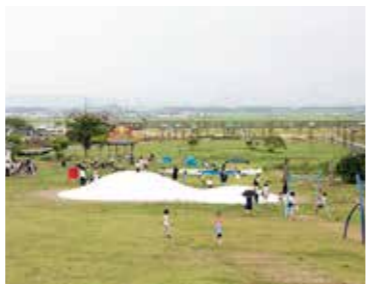
平成28年10月から順次利用を再開し、昨年7月に全面オープンした海岸公園。東部沿岸地域のにぎわいの拠点として、引き続き整備を進めます