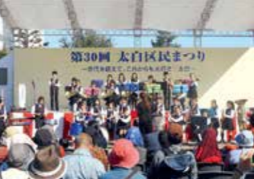
「太白区民まつり」のステージ発表の様子。多彩なジャンルの発表で、ステージを盛り上げます

区民協働まちづくり事業 区民の皆さんと協働でまちづくりを進めます。「太白区民まつり」や小学生の体験学習事業、区内の自然・歴史を探究する事業などを企画・開催するほか、公募により、市民団体が実施するまちづくり活動への助成を行います。また、地域づくりの担い手同士の交流の機会を創出するなど、地域づくり活動を支援します。