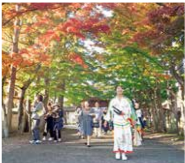
伊達武将隊と歴史的建造物などを巡るまち歩き体験では、仙台の歴史や魅力を感じることができます

交流人口拡大については、国内外からの誘客を消費につなげるため、本市ならではの多彩な体験プ