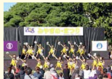
ステージ発表、露店、ブース展示など区民主体の手づくりによる「みやぎのまつり」

区民協働まちづくり事業 区民の皆さんと協働でまちづくりを進めるため、「みやぎのまつり」など各種イベントなどを企画・開催します。また、子育て、防災など幅広い分野でのまちづくり活動に助成を行います。