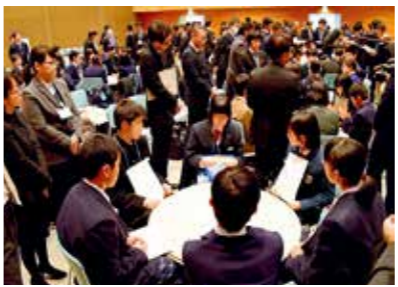
小・中学生が集い、いじめのない学校を目指して話し合う「仙台市いじめ防止『さげな』サミット」

14億3419万円 スクールカウンセラーの増員やSNSを活用したいじめ相談体制の充実、全ての市立中学生を対象とした学級生活等のアンケート調査の実施などにより、いじめの未然防止および早期発見、発生時の迅速かつ適切な対応を推進します。また、シンポジウムの開催などにより、広く市民に向けて啓発を行い、社会全体でいじめ防止に取り組む機運を醸成します。