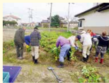
南蒲生町内会が開催したイベント「みんなの畑の収穫祭」

海辺のふる里づくり支援 津波被災地域において、まちの活性化等に取り組む団体や、集団移転跡地利活用を検討する地元団体を支援します。