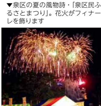
▼泉区の夏の風物詩「泉区民ふるさとまつり」。花火がフィナーレを飾ります

区民協働まちづくり事業 区民の皆さんと協働でまちづくりを進めるため、世代間交流の促進やふるさと意識を育てる「泉区民ふるさとまつり」、「七北田川クリーン運動」、「泉ヶ岳悠・遊フェスティバル」等を行います。また、地域と大学が連携して地域課題の解決を図っていく「いずみ絆プロジェクト支援事業」や「大学地域連携による課題解決事業」を行うほか、地域の特色を生かし、区民の皆さんが自主的に取り組むまちづくり活動への助成を行います。