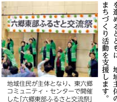
地域住民が主体となり、東六郷コミュニティ・センターで開催した「六郷東部ふるさと交流祭」

(仮称)七郷第二児童館建設 若林市民センター大規模修繕 道路整備 東部復興道路のほか、長喜城霞目線等の整備を行います。 橋りょう整備 六丁の目第2歩道橋等の補修工事を行います。 公園整備 海岸公園、荒井南1号公園等の整備を行います。