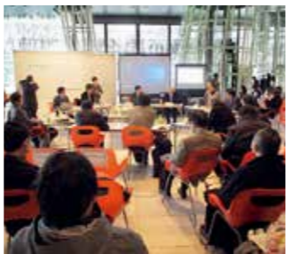
本庁舎の建て替えに向けて、市民やまちづくりに関わる皆さんとともに検討を進めていきます

市役所本庁舎の建て替えや定禅寺通の活性化に関する検討を進めるとともに、勾当台公園市民広場