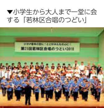
▼小学生から大人まで一堂に会する「若林区合唱のつどい」

区民協働まちづくり事業 区民の皆さんと協働でまちづくりを進めます。「若林区民ふるさとまつり」や「合唱のつどい」、地域資源の六・七郷堀を活用したイベント等を企画・開催します。また、公募により、市民団体が実施するまちづくり活動への助成を行います。