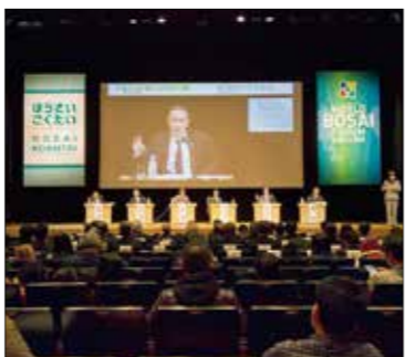
国内外の防災の専門家等が集う世界防災フォーラムでは、国際的な防災の課題について議論されます(写真は平成29年11月開催時)

災害救助法に基づく救助実施市の指定を受けることで、大規模災害時の被災者支援を迅速かつ円滑に行う体制を整えるほか、国土強靱化地域計画の策定に着手します。市中心部の震災メモリアル拠点の基本構想策定に向けた検討を進めるほか、小学生の校外学習での荒浜小学校活用による未来の防災の担い手づくりに取り組みます。また、世界防災フォーラムと仙台防災未来フォーラムを同時開催し、