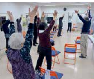
復興公営住宅等で、入居者同士が交流しながら、健康づくりや介護予防のための運動教室を行っています

被災された方々の心と体の健康状態を戸別訪問等により確認し、健康づくりや介護予防運動教室の実施、心のケアなど、一人一人の状況に合わせたきめ細かな健康支援を行います。