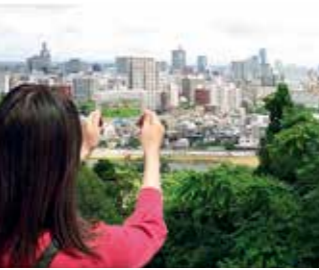
VRで歴史的風景等を再現する取り組みを進めています。仙台城跡からは、藩政時代の仙台の街並みを見ることができます

誘客を消費に結びつけ、地域経済の活性化につなげるために策定した「仙台市交流人口ビジネス活性化戦略」の推進に向けた取り組みを実施します。その重点的な取り組みの一つとして、本市の多様な観光資源の魅力を高め、旅行者が体験できるプログラムを発掘・創出するほか、VR（バーチャル・リアリティ）の活用等により誘客と市内回遊を促進します。