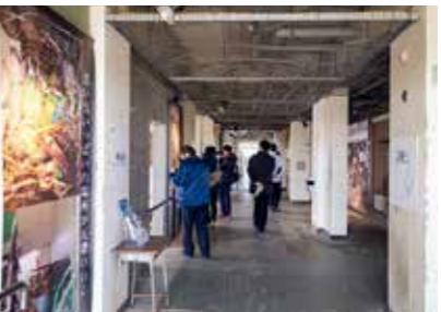
東日本大震災の遺構として公開している荒浜小学校。津波による犠牲を再び出さないため、その脅威や教訓を後世に伝えていきます