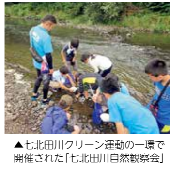
▲七北田川クリーン運動の一環で開催された「七北田川自然観察会」

ふるさと底力向上プロジェクト 少子高齢化が進む郊外居住地区において、地域・大学・事業者等が連携し、課題を解決する取り組みへの支援を行います。また、住民による泉西部地区の将来のまちづくりの検討を支援するとともに、地域資源の認知度向上や誘客に向けた情報発信を行い、魅力あるまちづくりと地域の活性化を図ります。