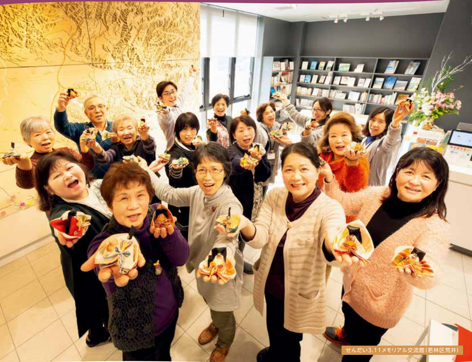
せんだい3.11メモリアル交流館(若林区荒井)

東日本大震災の行方不明者の帰還を願い作られる「かえりびな」。せんだい3.11メモリアル交流館での体験講座では、参加者が祈りを込めてかえりびなを制作しました。