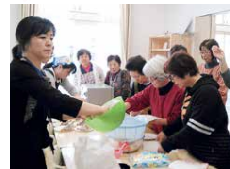
▲料理教室の様子。和気あいあいとした楽しい時間を過ごしています

女子会で震災前のつながりが戻ってきたように思います。人は人の中で生きられない、住民同士の交流が大切だと改めて感じています。