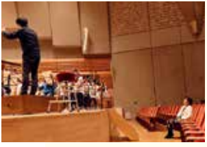
▲迫力ある演奏を体感。24日のコンサートが楽しみです

仙台ジュニアオーケストラは、公募で選ばれた小学5年生から高校2年生110人で構成され、日立システムズホール仙台を会場に月3、4回程度、仙台フィル楽団員から直接指導を受けながら練習しています。プロの演奏家から常時指導を受けられるジュニアオーケストラは全国的にも珍しく、大きな特徴です。私も昨年初めて演奏を聴かせていただきましたが、完成度の高