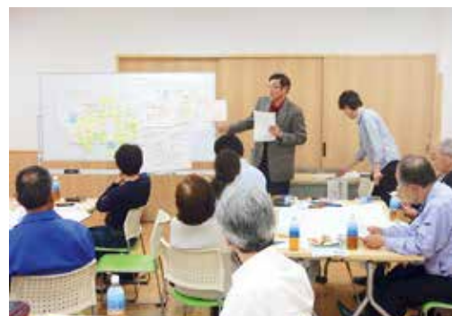
▲跡地利活用について、さまざまなアイデアが出されました

平成29年からは東六郷コミュニティ・センターで「ふるさと交流祭」を開催し、地域にゆかりのある人が毎回300人ほど参加しています。地域の伝統の黒潮太鼓や六郷ふるさと音頭などのステージ発表をしたり、参加者が集まって懐かしい話をしたりしています。定住人口は減りましたが、交流人口を増やすため、これからも地域の方以外にも参加いただけるような活動を計画していきたいです。