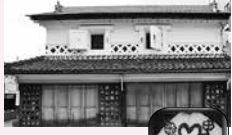
▲旧丸木商店と紋の一部