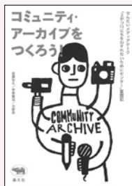
佐藤知久・甲斐賢治・北野央／著 晶文社 刊