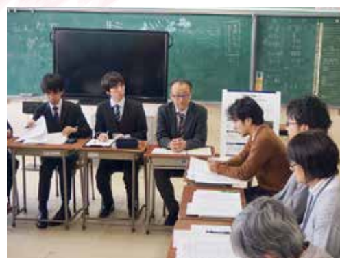
▲1月に荒浜小で手引書とワークシートの中間発表を行いました。3月10日の「仙台防災未来フォーラム2019」で完成報告をします

作成するうちに、荒浜小での出来事を自分ごととしてとらえるようになりました。子どもたちにも自分と結びつけて考えてもらいたい。記憶や記録はただ残すだけではなく、そこにいろいろな人の思いと行動が加わることで、本当の伝承、復興になると私たちは思います。