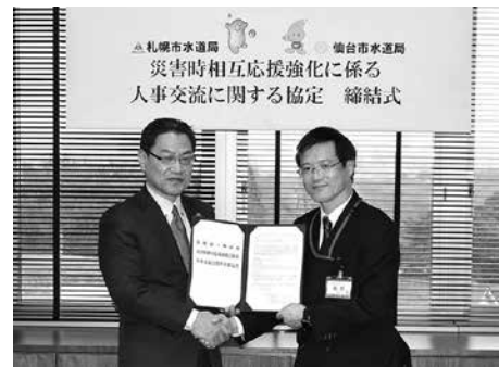
仙台市水道局本庁舎で行われた協定締結式

1月25日、仙台市水道局は札幌市水道局と、「災害時相互応援強化に係る人事交流に関する協定」