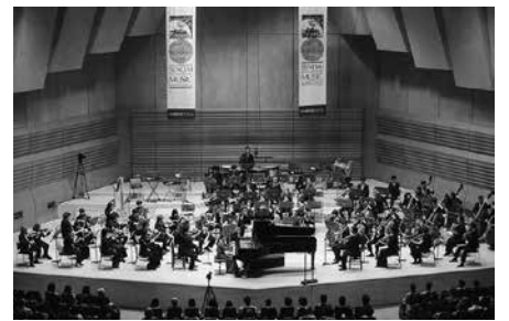
コンクールでは、仙台フィルハーモニー管弦楽団との協奏曲も披露されます