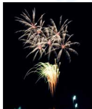
▲冬の夜空に咲いた鎮魂の花火

若林区六郷東部地区では、震災で住む場所が無くなり、住民が離れ離れになりました。戻ってきて暮らしている人もいますが、そうでない人もいます。みんなで再び交流できる機会をつくり、地域の活性化につなげようと、平成26年に「わたしのふるさとプロジェクト」を立ち上げました。