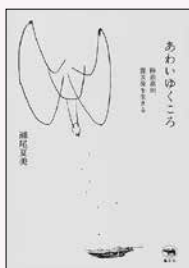
瀬尾夏美／著 晶文社 刊

東日本大震災を語り継ぐための市民図書館に設けた「3・11震災文庫」。所蔵する約1万冊からよりすぐりの本を、紹介します。