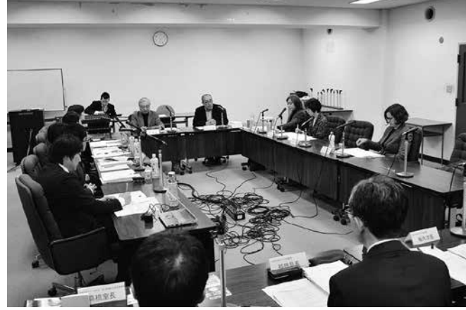
せんだい3.11メモリアル交流館