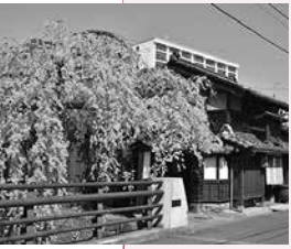
▲石橋屋。春には、立派な桜が迎えてくれます

◆歩行距離：2km ◆所要時間：30分（分速67mで計算） ※今回のコースは「杜の都景観重要建造物等―杜の都の歴史と文化の継承」（市役所本庁舎7階都市景観課で配布。市ホームページからもダウンロード可）を参照 問都市景観課 ☎214・8288