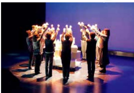
▲音楽演奏や震災の映像、キャンドルを使った演出に合わせて朗読しています

あの日から間もなく8年がたちますが、心の傷が癒えない方はたくさんいます。私自身も津波による被害に遭い、命の重さや大切さを痛感しました。記憶を風化させないために、また、これらの思いを感じてもらうためにも、ぜひ多くの方に聞いていただきたいと思います。