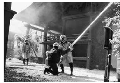
賀茂神社での消防訓練

仙台市内でも、大崎八幡宮や賀茂神社など11カ所で消防訓練を実施。町内会や婦人防火クラブの皆さんが参加し、通報訓練、文化財等の搬出訓練などを行いました。水消火器と水バケツリレーによる初期消火訓練では、参加者同士で声を掛け合う姿も見られました。