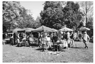
▲新寺小路緑道につながる新寺二丁目蓮池公園も、新寺こみち市の会場になっています