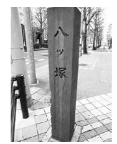
▲新寺通と東八番丁の交差点近くに立つ辻標

宮城野通駅の南側にあり多くの寺院が集まる新寺周辺は、かつて八ツ塚と呼ばれていました。寛永13年(1636年)頃の城下の拡張に伴い、今の元寺小路から寺院の一部を移したことから、新寺小路と呼ばれるようになったといわれています。新寺通と平行して延びる新寺小路緑道では、毎月28日に「新寺こみち市」が開催され、農産物やお菓子、雑貨などのお店が並びます。