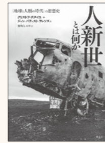
クリストフ・ボヌイユ + ジャン・パティスト・フレソズ / 著 野坂しおり / 訳 青土社 刊

46億年の歴史を持つ地球には多くの生命が誕生し、環境変化や大量絶滅を経ながらも発展してきました。しかし、人間による産業革命以降の変貌はますます激しく、この新たな時代を「人新世」と呼ぼうという考えが生まれました。