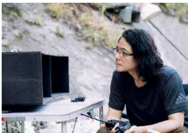
市内での撮影の様子

岩井 本当にふとした景色なんです。仙台で過ごした高校生までは感受性が豊かで、日々景色を見ては「じーん」としていました。雨が降ればその光景に、夕方になればその景色にと、取り立てて何ということもない景色に胸打たれて。高校では美術部に入り、風景