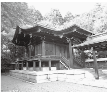
▲大正13年に建築された本殿。伝統形式で構成された建物に中世風の意匠が巧みに施されています

11月16日に開催された文部科学省文化審議会において、青葉区青葉町にある青葉神社の建物が、国の登録有形文化財に登録されることになりました。