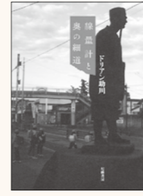
ドリアン助川 / 著 幻戯書房 刊

で走破した記録です。思いがけない場所でも高い線量が出る怖さ、多賀城や石巻には津波の爪痕が残り、被害の甚大さを肌で感じる旅となります。5年後に同じ場所を再び訪れると、汚染土を入れた黒い容器だけが増えていました。同時に、「プレートが複雑にうごめき合っている日本列島」を認識した著者の多様な心模様を読み取れます。