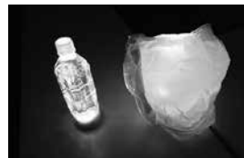
▲ライトの光をペットボトルの水に照らしたり、ビニール袋でかぶせたりすると、ランタンの代わりに

北海道胆振東部地震では、大規模な停電により多くの方の生活に影響がありました。停電への備えは大丈夫ですか。明かり確保のためのライトはすぐに取り出せる場所に保管。また、ラジオや携帯電話のモバイルバッテリーを準備し、乾電池は少し多めの備蓄を。停電により暖房が使用できなくなることもあるため、防寒対策に携帯カイロや厚手の衣類などの準備も必要です。突然の停電に備えて、自宅の備蓄品を再確認しましょう。