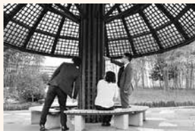
▲七北田公園のあずまや。シーンを思い出しながら、会話もはずみずみ

を通ると、地域の小学生が植えた色とりどりのビオラや葉ボタンが、道行く人の目を楽しませています。泉中央駅(図②)前のペDESTリアンデッキでは、同じく伊坂幸太郎原作の「重力ピエロ」を撮影。連続放火事件の鍵を握る女性を主人公が問い詰めるシーンの撮影は深夜まで及び、ビルの看板の明かりをつけるなど地域の協力もあったそう。近隣の店では、昨年公開された恋愛映画「ママレード・ボーイ」の撮影も行われました。 最後は少女漫画が原作の「俺物語!!」のロケ地、七北田公園(図③)へ。正義感にあふれ、純情で不器用な主人公の恋模様を描いた映画です。公園奥のあずまやでは、主人公に助けられた女性が、お礼のお菓子を渡し、一緒に食べるシーンが撮影されました。まねしてお菓子を食べて一息。市内には他にも映画のロケ地がたくさん。シーンを思い出しながら、訪ね歩いては。