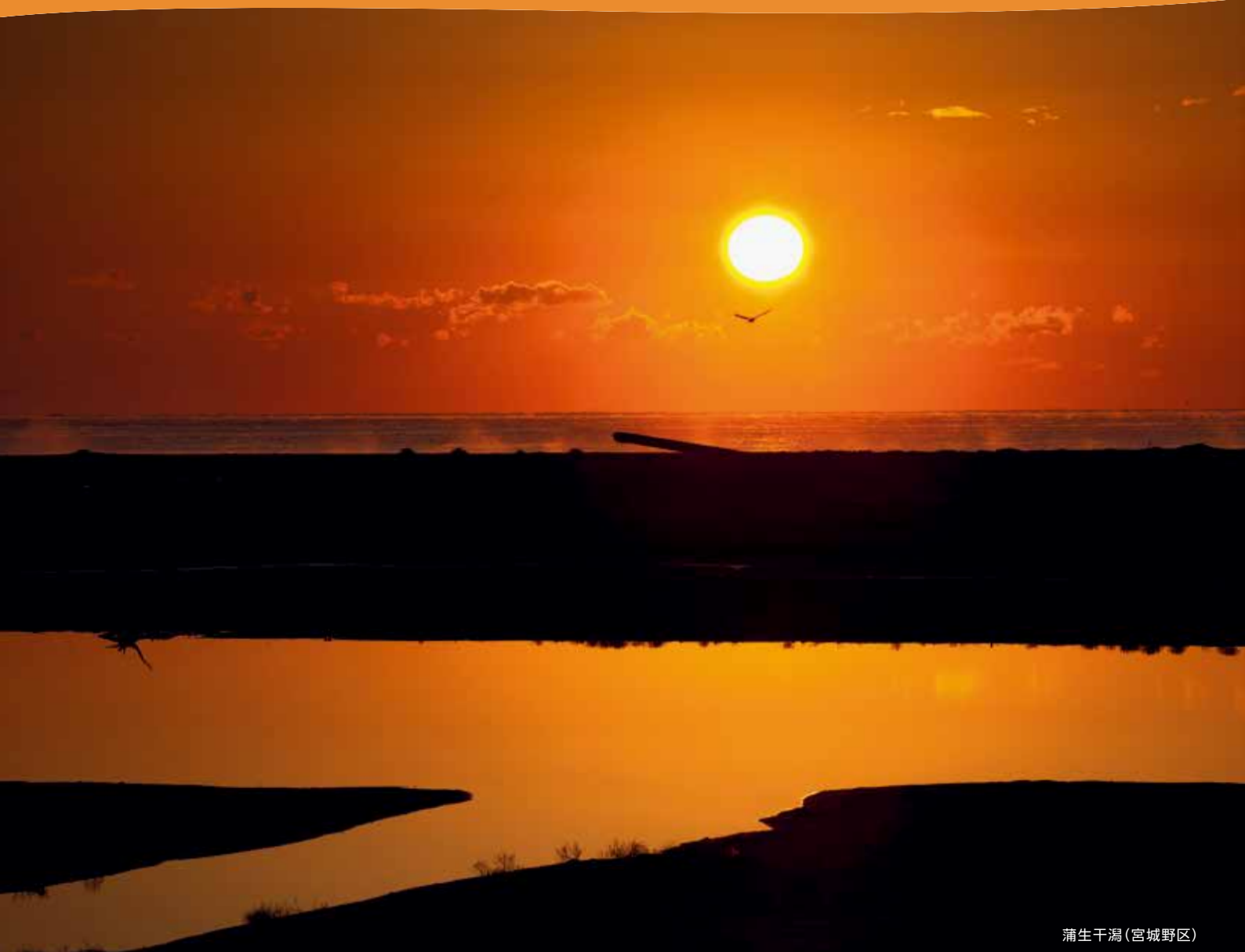
蒲生干潟(宮城野区)