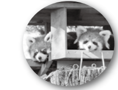
▲雄のユズ(左)と雌のナツメ(右)