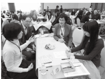
▲高校生から80歳代までの幅広い世代が参加。さまざまな視点で話し合いました

は市民の皆さんのご意見を伺う「みんなのせんだい未来づくり」を開催。約120人の市民が市の将来像について話し合いました。