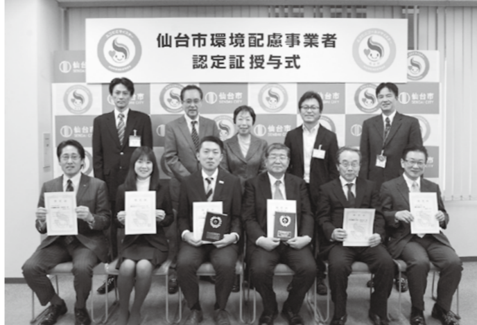
▲今回認定された事業者のみなさん(前列)

環境に優しい取り組みを行う事業者を「エコにこマイスター」として認定する制度を、本年度から開始しました。この制度は従前の「エコにこショップ・オフィス」認定制度を発展させたもので、ごみの減量やリサイクルなど、事業者の取り組み内容に応じて「エコにこマイスター」と「エコにこゴールドマイスター」の2つのラン