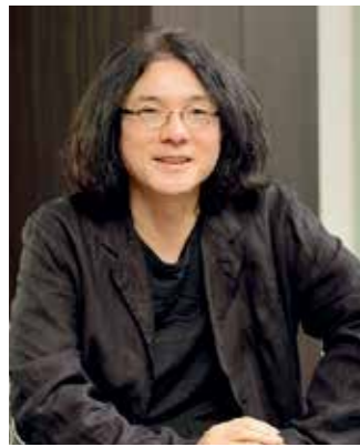
岩井俊二さん 1963年仙台市生まれ。映画監督、小説家、映像作家など活動は多岐にわたる。新作「Last Letter」では、監督・原作・脚本・編集を務めた