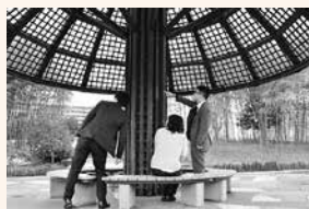
▲七北田公園のあずまや。シーンを思い出しながら、会話もはずみずみ

を通ると、地域の小学生が植えた色とりどりのビオラや葉ボタンが、道行く人の目を楽しませています。泉中央駅(図②)前のペDESTリアンデッキでは、同じく伊坂幸太郎原作の「重力ピエロ」を撮影。連続放火事件の鍵を握る女性を主人公が問い詰めるシーンの撮影は深夜まで及び、ビルの看板の明かりをつけるなど地域の協力もあったそう。近隣の店では、昨年公開された恋愛映画「ママレード・ボーイ」の撮影も行われました。 最後は少女漫画が原作の「俺物語!!」のロケ地、七北田公園(図③)へ。正義感にあふれ、純情で不器用な主人公の恋模様を描いた映画です。公園奥のあずまやでは、主人公に助けられた女性が、お礼のお菓子を渡し、一緒に食べるシーンが撮影されました。まねしてお菓子を食べて一息。市内には他にも映画のロケ地がたくさん。シーンを思い出しながら、訪ね歩いては。