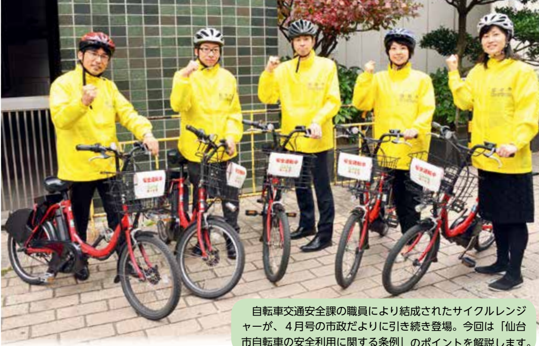
自転車交通安全課の職員により結成されたサイクルレンジャーが、4月号の市政だよりに引き続き登場。今回は「仙台市自転車の安全利用に関する条例」のポイントを解説します。