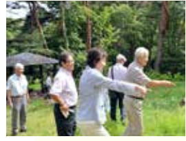
▲真美沢公園。草木がまぶしく美しい自然公園です

泉区旭丘堤にある真美沢公園で環境整備や緑化などの活動を行う「真美沢公園を美しくする会」の皆さんにお話を伺いました。