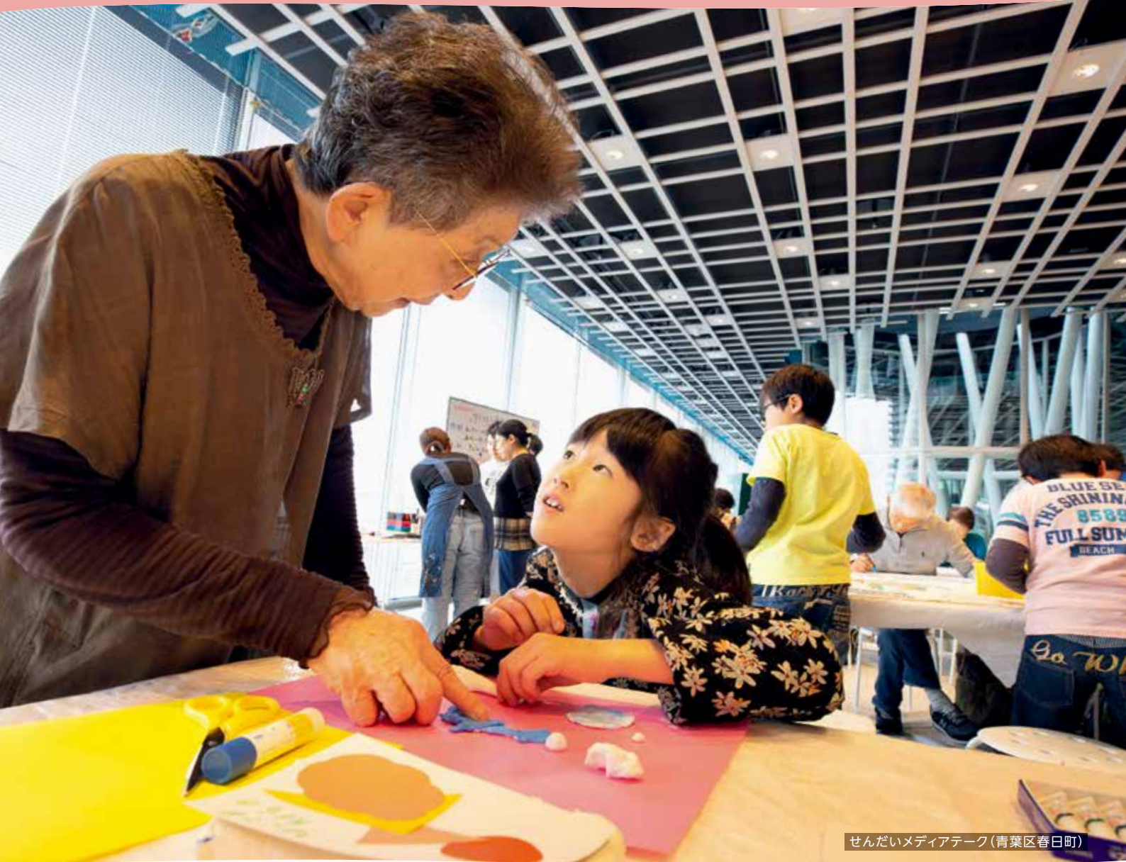
せんだいメディアテーク(青葉区春日町)

障害のある人もない人も、共に制作を行う芸術活動の場。和気あいあいと話し合いながら、自由な発想で絵や粘土などの作品を作り上げていきます。