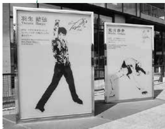
▲冬季オリンピック・フィギュアスケート競技で金メダルを獲得した、荒川静香さんと羽生結弦選手の偉業をたたえるモニュメント

【るーぷるの仙台】◆1周約70分 ◆運行=仙台駅始発の9:00~16:00まで平日20分間隔、土日祝日15分間隔(8月は全日15分間隔) ◆運賃(大人/小児)=一回乗車:260円/130円、一日乗車券:620円/310円