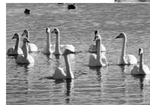
◀大沼に飛来した白鳥