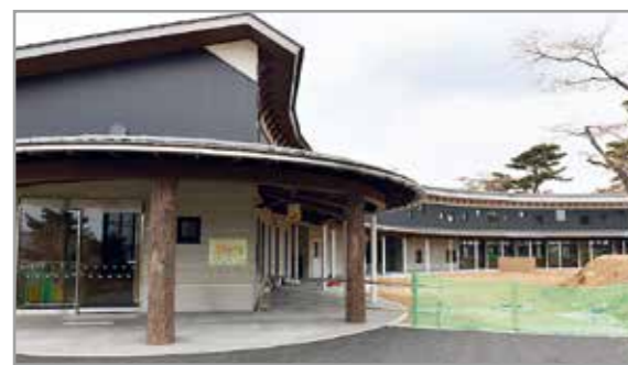
▲ふれあい館の外観