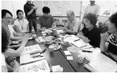
▲計画の策定に向けて、地域福祉 活動を行う皆さんが集まり、地域 課題を共有しました

東日本大震災の際に発揮された 「市民力」を原動力として、「障害」 「高齢」「子育て」「防災」など、地 域のさまざまな生活課題について、 市民や地域団体、 NPO、関係 機関などが連 携・協働しな がら、地域に