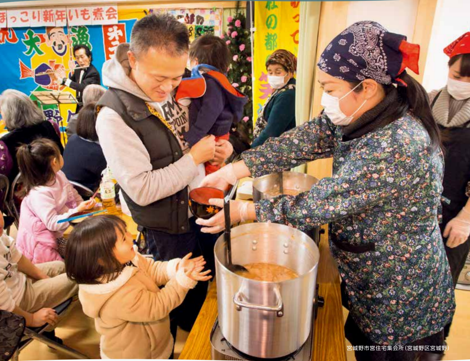
宮城野市営住宅集会所(宮城野区宮城野)

東日本大震災で被災された方々が入居する宮城野市営住宅で、住民が企画した新年会が行われました(2ページ参照)。