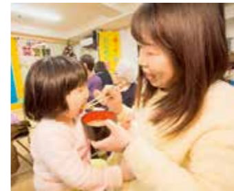
▲大きな鍋で作った芋煮。たくさんおかわりしました