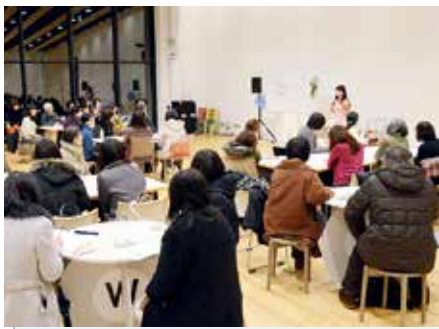
◀2月9日に行われた「かんぶつ(乾物)カフェ」講座。さまざまな年代の方が受講しました

東西線国際センター駅2階の「青葉の風テラス」では、平日の夜間に市民講座が開催されています。毎回多くの方が参加する市民講座「エキナカ大学」について取材しました。