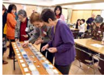
▲隔月で開催しているカフェ。1月19日には、石を選んでプレスレット作りを行いました

今後は、役員だけで実施してきた清掃活動に住民の方にも参加していただき、地域の関係団体と協力して活動したりできるように、頑張りたいです。