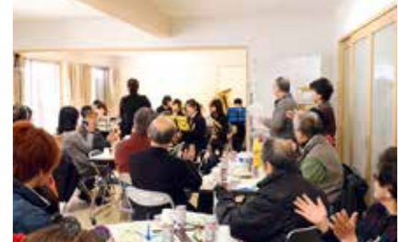
▲新年会で行われた茂庭台中学校ブラスバンド部の演奏

昨年12月に、入居者と地域団体等の支援者で組織する世話人会が発足し、指名により副代表を務めることになりました。市外から引っ越して来られた方も多く、いろいろな地域の方が入居しています。ご近所付き合いのきっかけになればと、月2回ほどオープンカフェを開き、コンサートやお茶飲みを楽しみながら交流を図っています。