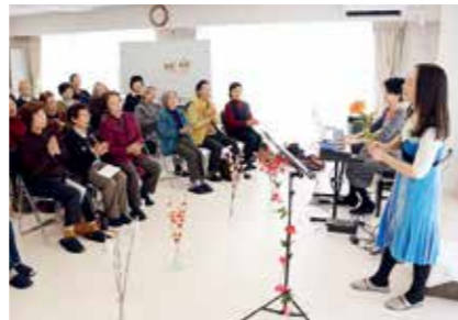
▲みんなで楽しく歌を歌う「歌声サロン」

男性の参加が少ないので、男性の皆さんが興味をもって楽しんでもらえるイベントを企画していく予定です。