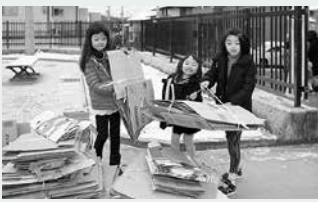
▲「大きな段ボールも運べるよ」 と笑顔を見せる子どもたち

1人1日当たりの家庭ごみ 目標：450g → 実績：476g (平成28年4月～平成29年1月の速報値) まだまだごみは減らせるはず。使い終わった教科書やノート、プリント類もしっかり分別しましょう！