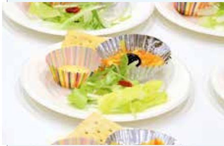
▲干したみかんの皮などを使用した料理