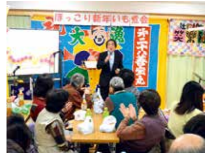
▲大漁旗を飾って行われた新年会。弾き語りや落語を楽しみました

一昨年11月から設立準備を始め、昨年4月に自治会が設立されました。元々人と関わり合うことが好きだったので、町内会設立準備会に参加するようになり、それ以来役員を務めています。この自治会の特徴は、女性や若い方が活躍していること。新年会には約80人の住民が参加し、大いに盛り上がりました。