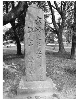
▲「あやめ草 足に結ばん 草鞋の緒」と記された芭蕉の句碑