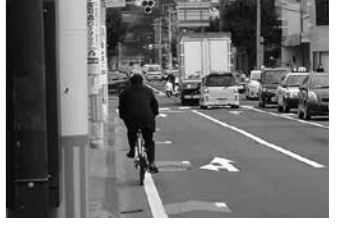
矢羽根表示の部分は自動車等も通行する(写真上)ので安全確認を