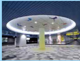
▲天井を舞うシジュウカラガシ

戸建て住宅が広がる地域で、周辺には八木山動物公園などの観光施設が立地。日本一標高が高い地下鉄駅に認定された八木山動物公園駅の駅舎内は、動物の写真や足跡を配置するなど、楽しい空間になっています。