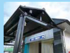
▲外観は東屋風のデザイン

薬師堂駅周辺には、「陸奥国分寺跡」などの歴史資源や、区役所等の公共施設、野球場など多様な施設が立地しています。駅前広場も整備され、バス等への乗り換えも便利です。