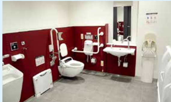
▲東西線全駅に「ひろびろトイレ」を2カ所設置

駅や車両は、高齢の方や障害のある方にも配慮した造りになっています。また、仙台駅には授乳室があるほか、各駅の男性用トイレにも乳幼児用椅子を設置するなど、お子様連れの方も安心してご利用いただけます。