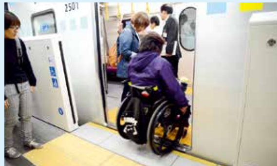
▲ホームと車両は段差が少なくスムーズに乗降できます

この特集に関するお問い合わせは交通局東西線建設本部管理課 ☎712・8359、運賃や所要時間など運行に関するお問い合わせは交通局案内センター ☎222・2256 (平日8:30~18:30、土・日曜日、祝休日8:30~17:00)