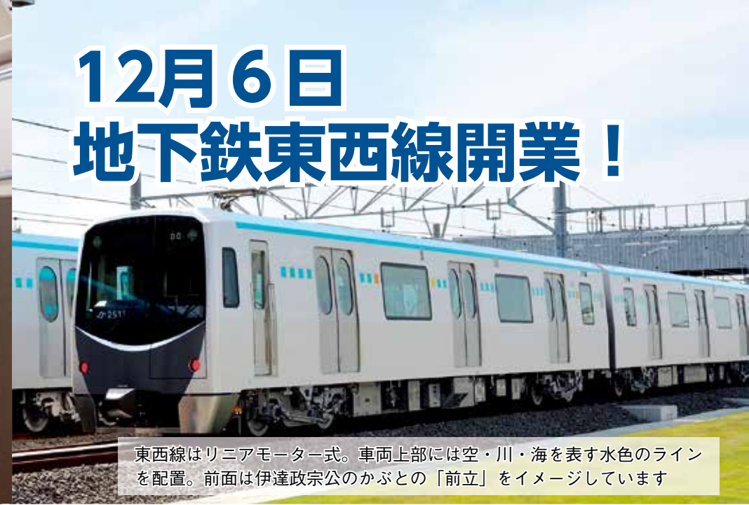
東西線はリニアモーター式。車両上部には空・川・海を表す水色のラインを配置。前面は伊達政宗公のかぶとの「前立」をイメージしています