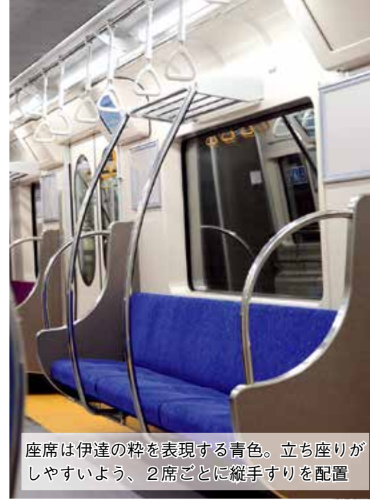
座席は伊達の粹を表現する青色。立ち座りがしやすいよう、2席ごとに縦すりを配置