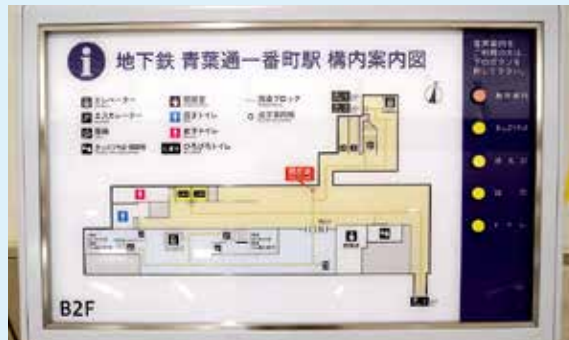
▲駅構内の改札口やトイレなどを、点字や音声で案内