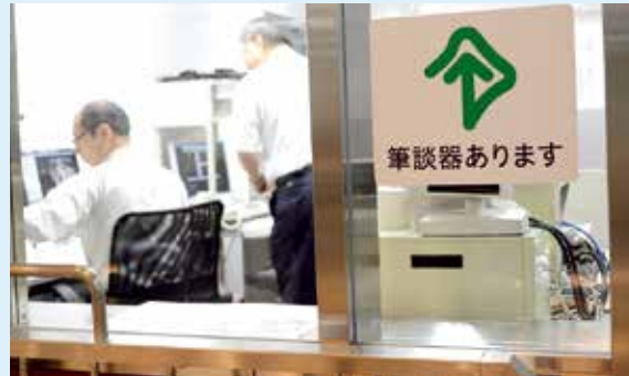
▲改札口隣にある駅務室には、筆談器も備えています