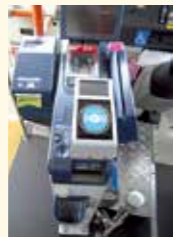
バスでもicscaの利用が可能です

●icscaを新規で購入する際は、500円のデポジット(預かり金)が必要です。カードが不用になった際は、カードと引き換えにデポジットをお返しします