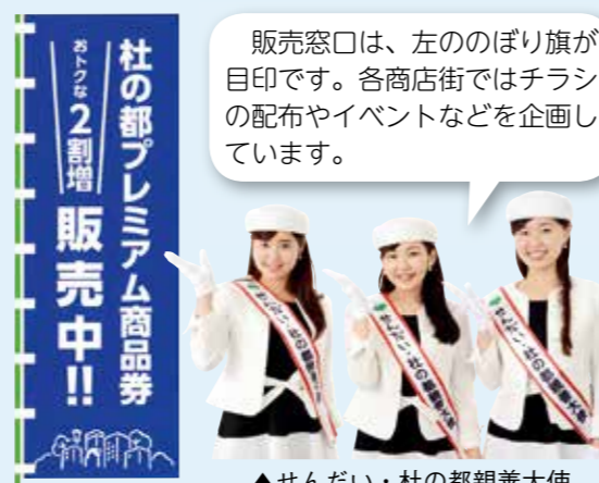
▲せんだい・杜の都親善大使

販売窓口は、左ののぼり旗が目印です。各商店街ではチラシの配布やイベントなどを企画しています。