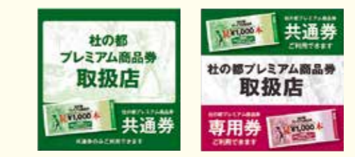
▲取扱店の目印になるステッカー。利用できる券の種類によってデザインが異なります

地元の経済界をあげて準備を進めています 市と仙台商工会議所・みやぎ仙台商工会・宮城県商店街振興組合連合会は、平成27年3月に実行委員会を設立し、販売に向けた準備を進めてきました。