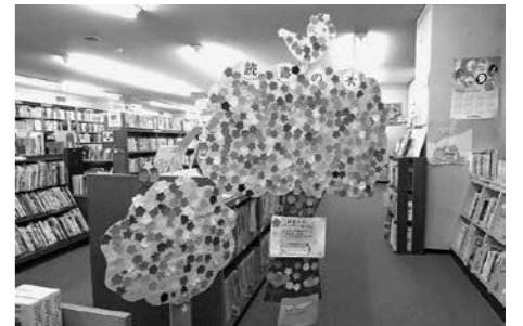
子どもたちが本を借りると花が咲く「読書の木」

4月23日は「子ども読書の日」、4月23日～5月12日は「子どもの読書週間」です。子ども読書推進活動の一環として、図書館ではさまざまな行事を行います。また、恒例行事のおはなし会もあります。ぜひお越しください。