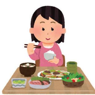
栄養バランスのとれた食事