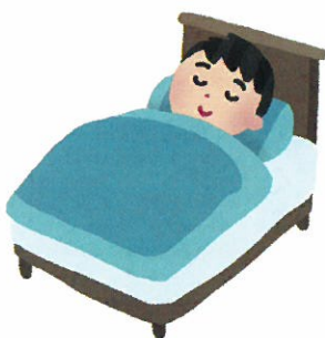
十分な睡眠を とりましょう

①十分な睡眠、②栄養バランスのとれた食事、③適度な運動、④禁煙を心がけましょう。