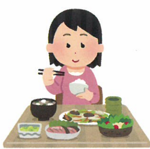
栄養バランスのとれた 食事をしましょう