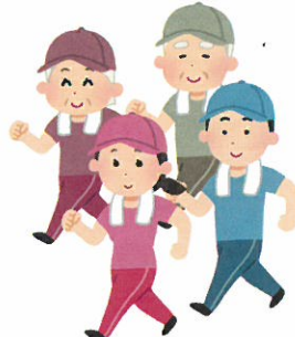
適度な運動を しましょう