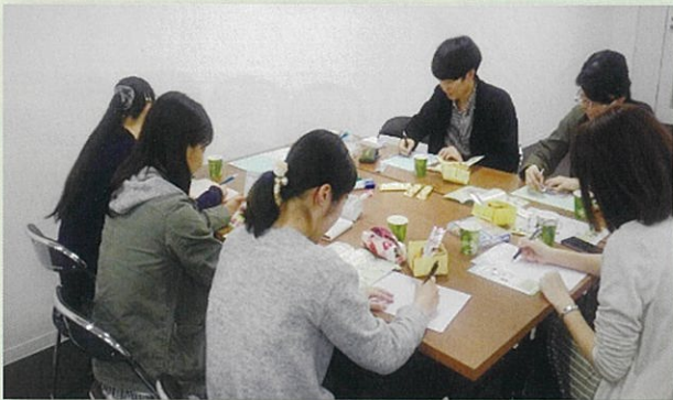
毎月の話し合いの様子