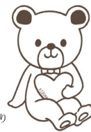
仙台市こころの健康づくり キャラクター「ここまる」