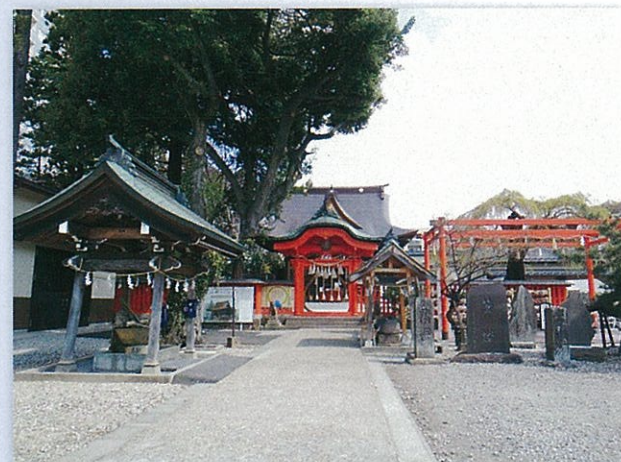
①「つゝじが岡及び天神の御社」(宮城野区榴ヶ岡、五輪)

『おくのほそ道』に「天神の御社」と記された榴岡天満宮と、榴岡公園の西側の一画です。境内には、寛文7年(1651)建立の唐門や、樹齢300年以上とされるシダレザクラ・シラカシなどが残るほか、芭蕉を称える句碑が数多く並んでいます。