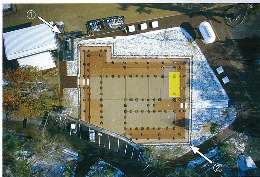
【大広間の遺構表示を真上から見た写真】