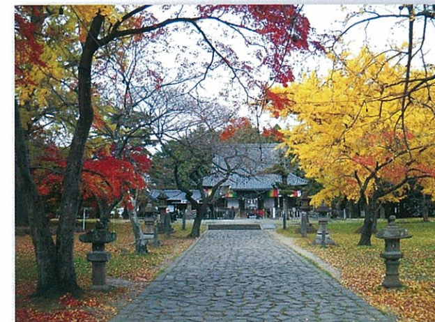
②「木の下及び薬師堂」(若林区木ノ下)

『おくのほそ道』に「天神の御社」と記された榴岡天満宮と、榴岡公園の西側の一画です。境内には、寛文7年(1651)建立の唐門や、樹齢300年以上とされるシダレザクラ・シラカシなどが残るほか、芭蕉を称える句碑が数多く並んでいます。