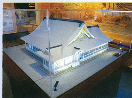
【展示してある大広間の模型】 ①と同じ方向から見えています。

仙台市文化財課では、発掘調査の成果に基づき、建物規模や部屋割りを実際の場所に復元、「仙台城見聞館」を改装しました。見聞館では、藩主が座る「上段の間」の床の一部を実物大で再現、大広間の50分の1立体模型を展示しています。野外表示と併せて見ることで、よりいっそう大広間を体感いただけます。