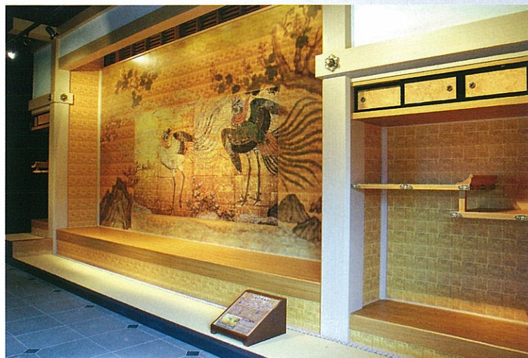
【「上段の間」の床(とこ)】

下の写真の黄色い部分を実物大で再現しています。上段の間に描かれていた鳳凰の障壁画を再現しました。