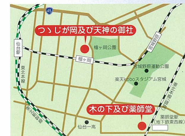
【名勝指定地の位置】

江戸時代に活躍した俳人・松尾芭蕉が、元禄2年(1689)から4年にかけて、弟子の河合曾良とともに東北・北陸を巡った旅の紀行文です。この旅の中で、仙台には元禄2年5月に訪れています。