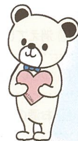
仙台市こころの健康づくりキャラクター 「ここまる」