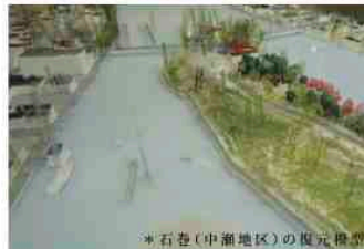
*石巻(中瀬地区)の復元模型