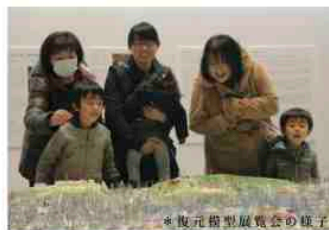
*復元模型展覧会の様子