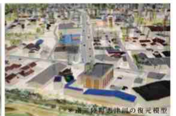
*宮城県志津川の復元模型