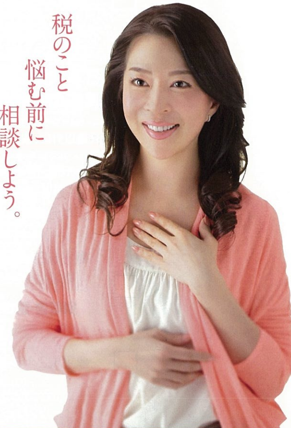
税理士会 イメージキャラクター 真矢 みき