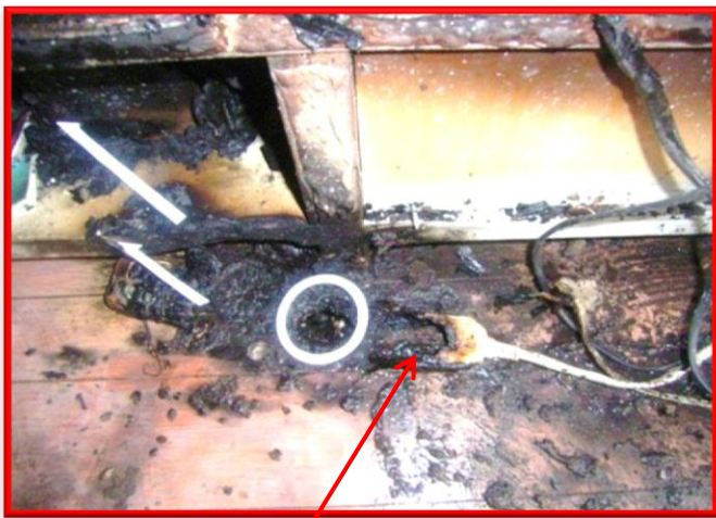
タップの先端が激しく焼けています！

コンセントや電気コードのショートから発生する、いわゆる「トラッキング」や「使用の不適」によるものです。暖房機器やガスこんろとは違って、通常火の気が無いところから出火することから、就寝中や留守中に発生、拡大するため大変危険です。