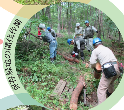
保存緑地の間伐作業