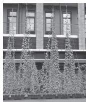
▲たまきさんサロンでの設置例