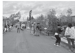
▲第39回北海道フェアの庭園出展の様子