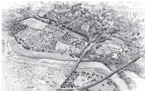
▲メイン会場イメージ図