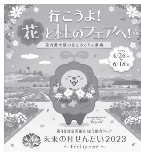
▲PRポスター（中央はマスコットキャラクター「フォレッピー」）