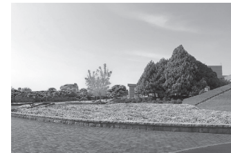
▲「アイスガーデン」イメージ図