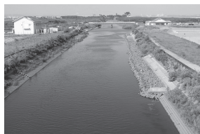
▲令和版100選「貞山運河」