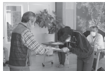
▲昨年の修了式の様子