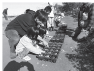
▲播種体験イメージ

海岸公園センターハウス ☎ 288-4021 問 百年の杜推進課緑地保全係 ☎ 214-8392