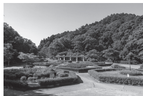
▲令和版100選「台原森林公園」