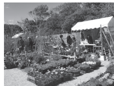
▲前回（令和4年度）の植木市の様子