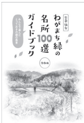
▲「令和版わがまち緑の名所100選」ガイドブック表紙

4月には「杜の都・仙台 令和版 わがまち緑の名所100選」ガイドブックを発行します。名所各地の様々な魅力をお伝えるため、ガイドブックには市民の皆さまが撮影した写真、名所を詠んだ俳句や短歌を掲載しています。写真、短歌、俳句の作品をお寄せいただきました皆さまに改めて感謝申し上げます。ガイドブックは4月26日に開幕する全国都市緑化仙台フェアの期間中、青葉山公園仙臺緑彩館で販売するほか、市政情報センターおよび宮城野区・若林区・太白区情報センターでも販売する予定です。