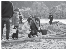
▲球根を投げ入れる子どもたち