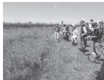
▲地域について学ぶ

☎ FAX 288-4021 メールアドレス: ikujukai@sendai-park.or.jp