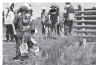
▲昨年のミニイベントの様子