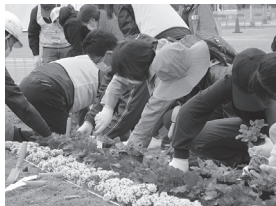
▲大花壇植え付けの様子