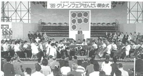
▲前回開催時の開会式の様子

現在、令和5年春の開催を目指し、全国都市緑化仙台フェア基本構想懇談会を設置し、基本構想の検討を進めています。