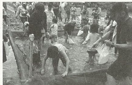
▲生きた魚をつまめるのは思ったより大変!