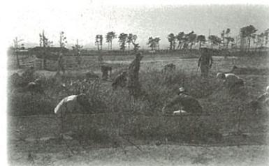
▲苗木がどこにあるのか分からない状態でしたが…

7月29日(金)、今年の3月に市民植樹を行った海岸公園蒲生地区(宮城野区)で、除草やマルチングなどの手入れ作業を行いました。作業には、ふるさとの杜再生プロジェクト連絡会議の有志17名が参加。作業前は、地面が雑草に覆いつくされ苗木が全く見えない状態でしたが、除草を行うと元気に育つ苗木の姿が確認できました。