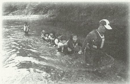
▲小グループに分かれて川の中をお散歩