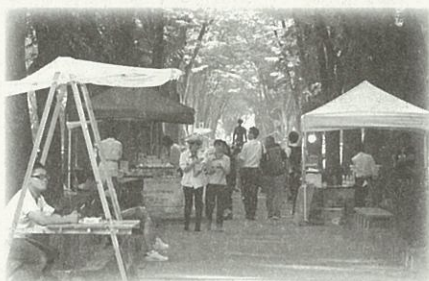
▲3rd LIVINGとは直訳すると第3のリビング。自宅、職場や学校に次ぐ3箇所目の“居場所”づくりがコンセプト。