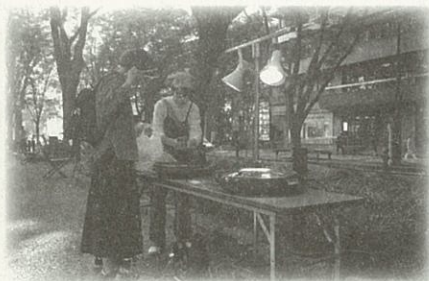
▲通路脇に設置されたホットプレート。好きなものを自由に焼いて食べることができました!