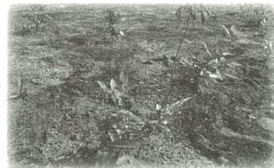
▲除草作業後の様子。しっかり育っていました！