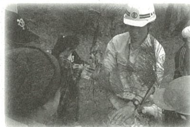
▲採取した実生苗に養生をして学校に持ち帰ります

8月29日(月)、七郷小学校の4年生160名と、認定NPO法人冒険あそび場せんだい・みやぎネットワークをはじめとする連絡会議の関係者ら13名とで、海岸公園井土地区(若林区)の冒険広場内に造られた避難の丘の見学と、海岸公園の整備工事に伴って失われる可能性のある実生苗の採取を行いました。このプロジェクトは、東日本大震災時の冒険広場の様子を事前に学んだ子どもたちが「自分たちにできることは何か」ということをテーマに企画しました。採取した苗は学校で育て、公園が全面的に再開する2年後に公園に植樹する予定です。