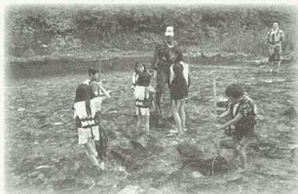
▲川の中には、どんな生き物がいるかな?

※1 広瀬川市民会議…広瀬川の魅力を次の世代に引き継いでいくための行動計画として策定された「広瀬川創生プラン」の推進主体として広瀬川をテーマに様々な活動を行っている市民団体。