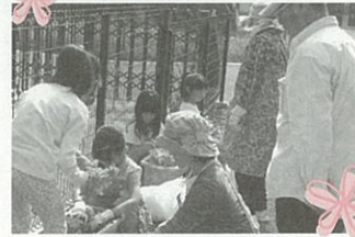
▲みんなで協力して花苗を植えました

問 宮城県花と緑普及促進協議会事務局（宮城県農産園芸環境課内）☎211・2843