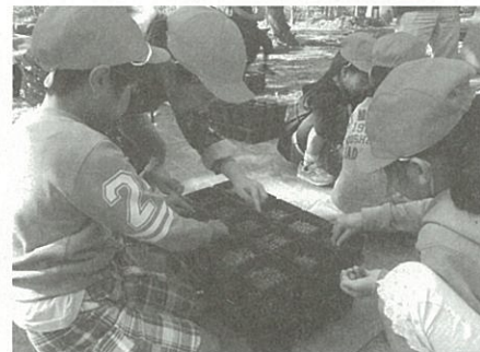
▲公園内でどんぐりを拾い1個ずつポットに蒔きました

3月下旬に海岸公園蒲生地区で行う市民植樹では、向山小学校4年生が2年生のときに蒔き、育てているどんぐりの苗木を植える予定です。