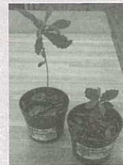
▲春に芽を出し、こんなに成長しました！

詳細が決まりましたら、仙台市ホームページでお知らせするほか、フォーラムに参加申込をされた皆さんには、ご案内をお送りします。