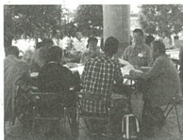
平成27年8月30日(日) 於：七北田公園都市緑化ホール

http://www.city.sendai.jp/shizen/midori/keikaku/1208008_1729.html