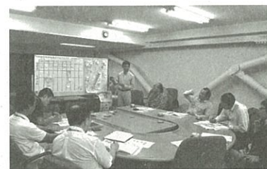
▲会議では、活発な意見が出されました

会議では、各団体の東部地域におけるみどりの再生に向けた取り組みや、全国からの支援受入状況について情報交換し、今年度の市民植樹や今後のプロジェクトの進め方などについて話し合いました。