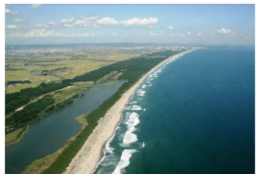
震災前の仙台市沿岸部