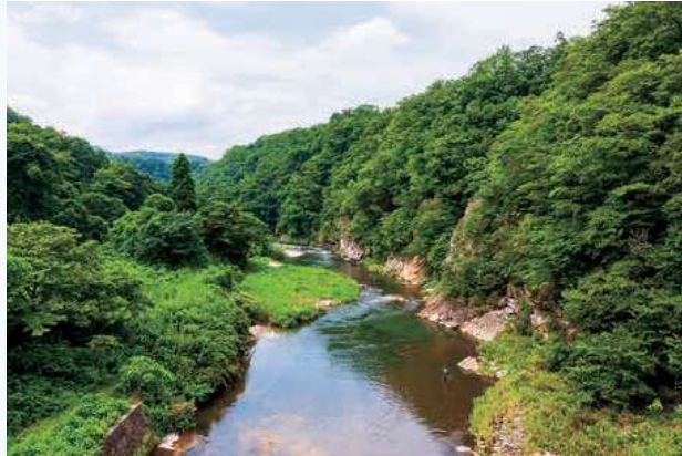
▲苦地橋からの眺望

を渡るダイナミックな光景も楽しめます。下流の野川橋付近にある大きな白い崖は、大昔の火山活動で生まれた白沢カルデラ内の「古仙台湖」の堆積物が川に侵食されてできました。柿崎橋や鳴合橋の上からも、両岸の深い緑の間を川が流れる美しい景観を見ることができます。