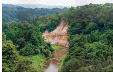
▲熊ヶ根橋付近 深い峡谷