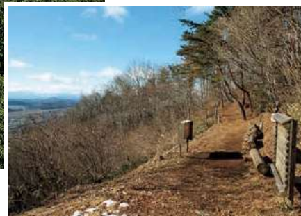
▲眺望スポット 冬には遠くまで見渡せる