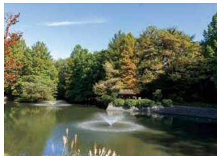
▲広々とした水辺の風景を楽しめる