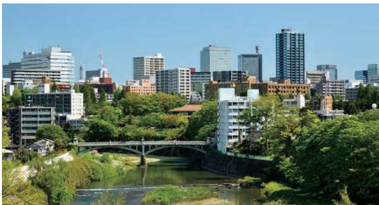
▲下流側から見た霊屋橋 建物の間に緑が映える