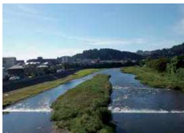
▲大橋から下流の眺望