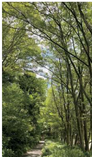
▲霊屋橋下流の遊歩道