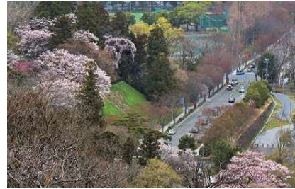
▲仙台城跡北側