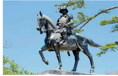
▲伊達政宗公騎馬像

青葉山公園の拠点施設として整備された仙臺緑彩館では、大きな広場と一体で展開される多彩なプログラムで、仙台・青葉山の歴史や文化、自然の魅力を感じられます。