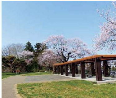
▲二の丸跡のサクラ