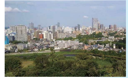
▲本丸広場からの眺望