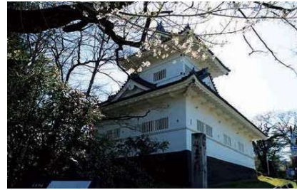
▲大手門脇櫓