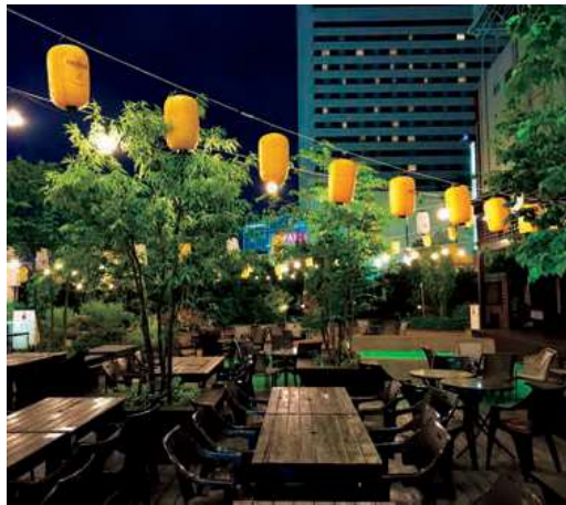
▲夏のビアガーデン