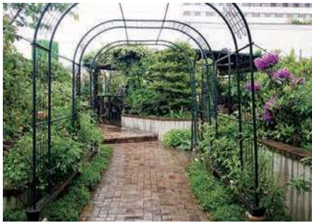
▲緑に包まれる空間

にベンチやデッキが設置されているおしゃれな空間になっています。イベントステージでは、ショーやライブ演奏なども頻繁に行われています。冬にはイルミネーションが行われることもあり、さまざまなイベントで一年中楽しめる都会のくつろぎスポットです。