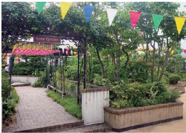
▲杜のガーデンテラス