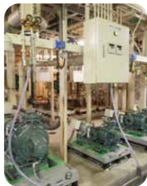
▲水を循環させる冷温水二次ポンプ