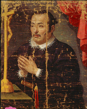
支倉常長像 (慶長遣欧使節関係資料)