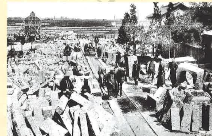
長町にあった秋保石材軌道の石置き場(「秋保石材軌道株式会社」宮城県図書館蔵)

もう一つは、石材を運ぶために秋保と長町を結んだ秋保石材軌道で、開業は今から100年前の大正3年(1914)。石の運搬だけでなく、秋保温泉へのアクセス鉄道としての役割も果たすようになり、その後軌道を拡幅して電化され、大正14年には電車が走るようになりました。