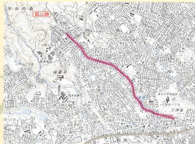
※国土地理院発行の地形図「仙台西南部」(平成20年)に加筆 金剛沢鉱山のトロッコ軌道跡