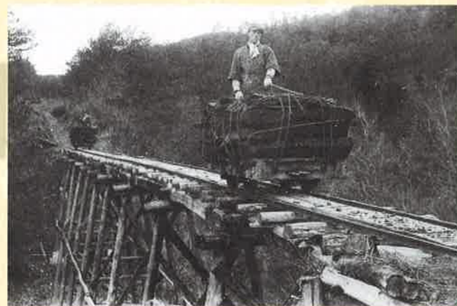
金剛沢鉱山における昭和前期の亜炭搬出用トロッコ軌道(個人蔵)

昭和30年代まで仙台市内の暖房や風呂焚きを支えた燃料は亜炭でした。青葉山から八木山にかけての丘陵帯には、小規模な亜炭鉱山があちこちに坑道を開いていました。その中でも代表的な鉱山だった金剛沢鉱山(太白区八木山南北隣)では、大正時代からトロッコを用いて坑口から山麓の西多賀へ亜炭を運んでいました。昭和18年(1943)にトロッコでの搬出が廃止され、その後、鉱山もなくなってしまいました。軌道の跡は今も団地の中に道路として生き残っています。