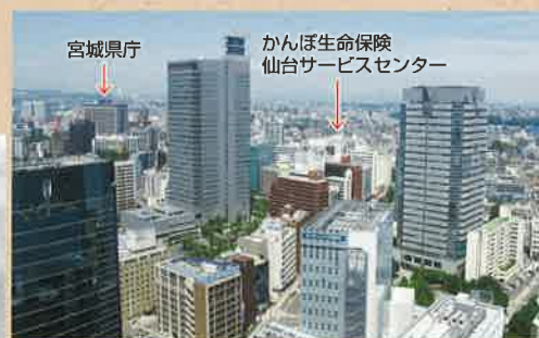
アエル仙台から見たかんぽ生命保険仙台サービスセンターと宮城県庁