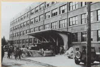
アメリカ軍に接収されたころの仙台簡易保険支局

古い建物が次々に壊され、戦前の記憶を持つ建物もわずかになった現在の仙台。このビルは、戦争や開発の波をかいくぐって残された数少ない歴史の証人と言えるでしょう。