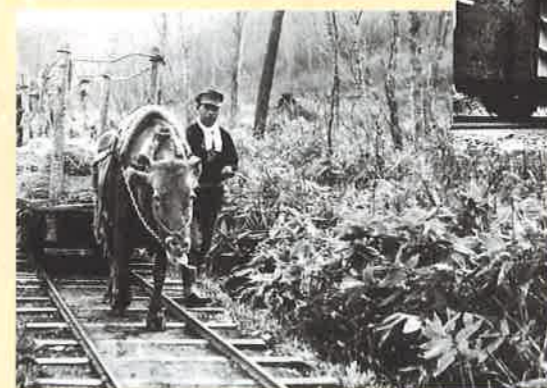
昭和27年(1952)以降、定義森林鉄道で使われるようになった機関車(個人蔵)

昭和10年代から30年代にかけて、定義(青葉区大倉)や奥新川(太白区秋保町馬場・青葉区新川)にも森林鉄道が敷設されました。定義森林鉄道の場合、沿線に戦後の開拓集落である十里平があるため、人々は自前のトロッコを使って必要な荷物を運搬するだけでなく、軌道敷を生活道路代わりにするなど、生活に密着したのとなっていました。