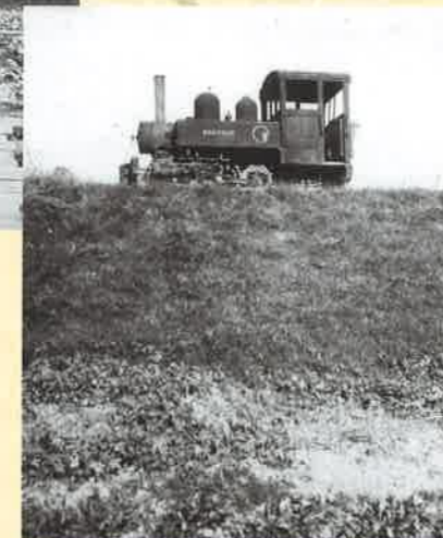
昭和25年(1950)に藤塚周辺の堤防工事で用いられた小型のSL

小さなSLが一所懸命に運んだ土砂などが大きな堤防となって、今も人々の生活を守っているのです。