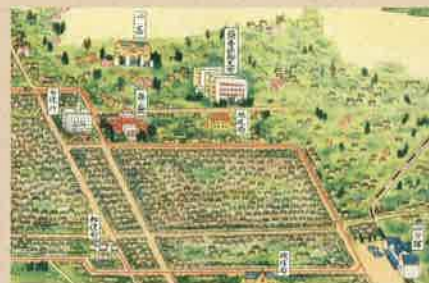
昭和前期の絵葉書に描かれた仙台簡易保険支局の周辺(仙台市博物館蔵)