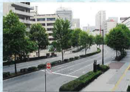
JR仙台病院付近の愛宕上杉通 平成25年7月撮影 手前が清水小路、屈曲の先は東五番丁