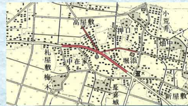
昭和52年ころの荒井付近 部分の十字路が「十字」の由来 (国土地理院発行2万5千分の1地形図より)