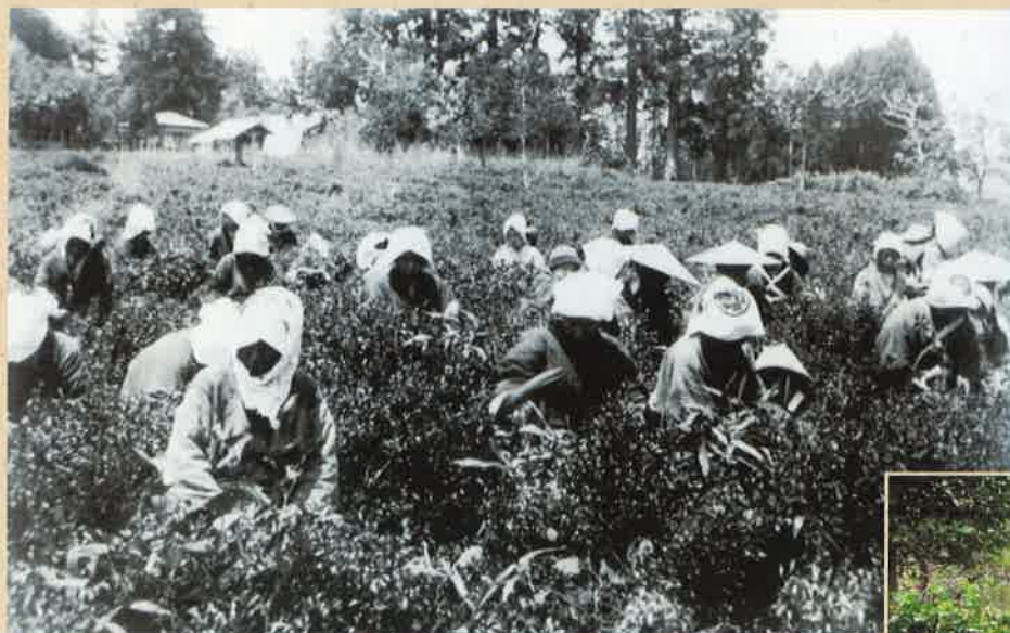
大年寺山での茶摘み風景 大正5年(1916)ころ (個人蔵)