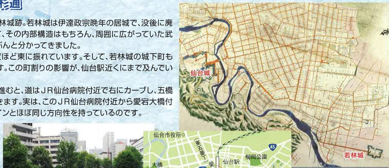
仙台北下絵図(部分) 18世紀後半 (仙台市博物館蔵)

つまり、JR仙台病院付近での道の屈曲は、政宗が作った二つの城下町、仙台北下と若林城下が出会った場所なのです。