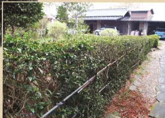
若林区今泉に残る、茶の生け垣 平成23年撮影