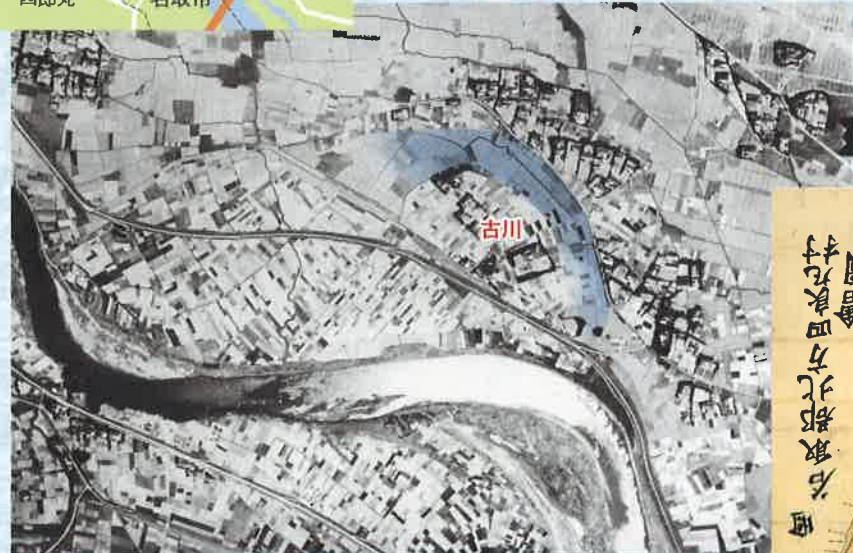
昭和36年の古川付近 部分にかつての名取川の痕跡がうかがえる

もともと四郎丸だったこの土地は、名取川の流れが変わった後も長らく、四郎丸村として扱われていました。明治時代になっても、この地域の人たちは川を渡って、四郎丸が含まれる中田の学校や役場に通っていたのです。そして仙台が政令指定都市になった時、地域の区分が新たに直視され、「今泉字古川」となったのです。