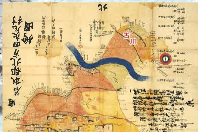
文政の村絵図に描かれた古川周辺 19世紀前半 この頃にはすでに、名取川の流路は南に移っている (仙台市博物館蔵)