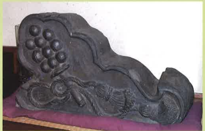
真壁屋の味噌蔵に葺かれた瓦 個人蔵