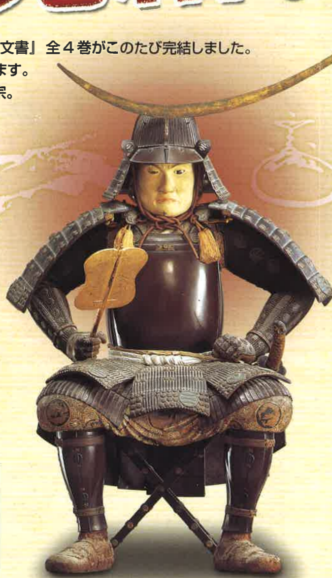
伊達政宗甲冑像 瑞巖寺所蔵