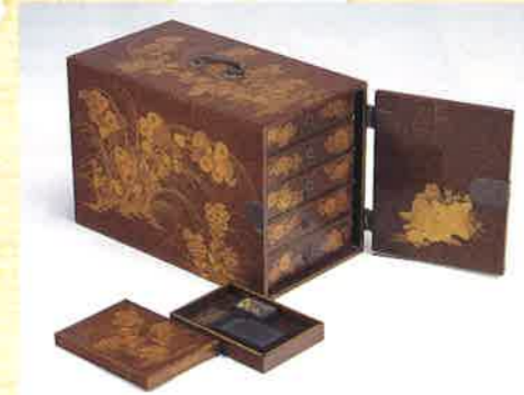
政宗が高屋松庵に与えたと伝えられている薬単筒 個人蔵