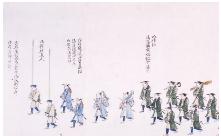
「安政四年御野初行列図巻」(鷹匠部分、仙台市博物館所蔵)

駐車場には限りがあるため、公共交通機関のご利用にご協力ください。 なお、お車の場合、北環状線から市民センターへ直接入ることはできません。 送迎の方はお気をつけください。