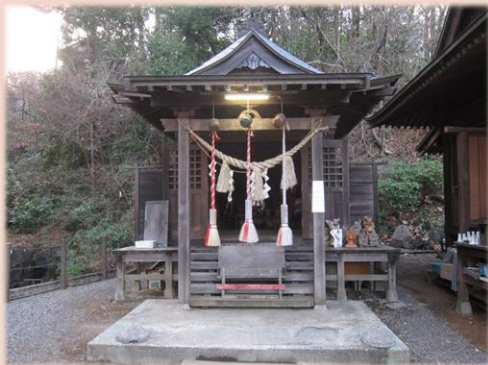
▲中山鳥瀧不動尊(青葉区中山)