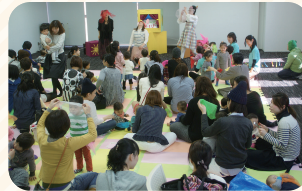
▲昨年初めて開催した「mammaまつり」の様子。体操や段ボール迷路、ねぞうアートなどで親子がふれあいました。

部会のメンバーは民生委員児童委員、のびすく仙台、のびすく宮城野、アミューズおひさま、せんだい杜の子ども劇場、児童館、高砂保育所子育て支援室、家庭健康課、まちづくり推進課で構成されています。様々な機関が協力し、関係を構築させ、子育ての支援が繋がっています。これからも安心して、楽しく子育てができるような活動をしていきます。