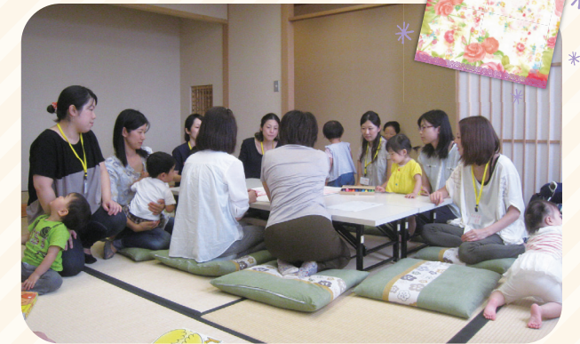
▲「ママ会」の様子。お子さんを連れて参加される方も多かったです。