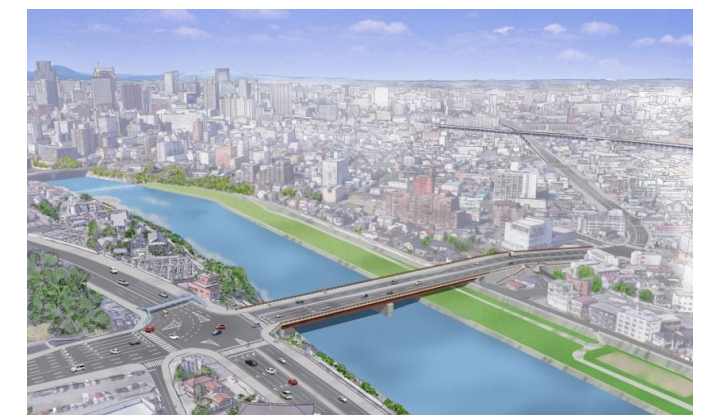
＜完成後のイメージ図＞